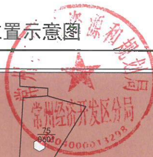
拟征收土地位置示意图